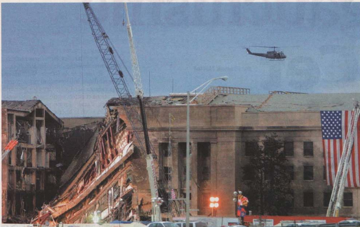
La façade éventrée du Pentagone, le 11 septembre 2001. Un attentat du "lobby" militaro-industriel américain... selon Meyssan.

➤ Michel Sitbon: "Je vends du sexe parce que la matière première est plus agréable que des meubles ou des maisons. La pornographie est une manne pour la presse et l'édition."